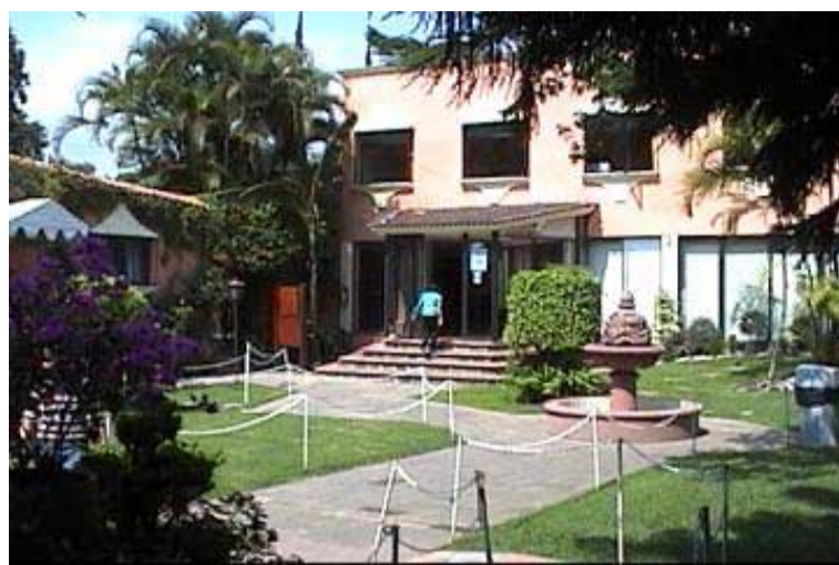
Las nuevas instalaciones de Rectoría a 25 años de iniciar actividades