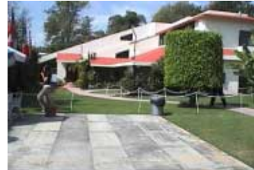
Las instalaciones del Edif. 12, donde se encuentra el Departamento de Arquitectura

reconstrucción de cómo se piensa que fue el Coliseo Romano) y maquetas de construcciones importantes. Este tipo de apoyo didáctico facilita al estudiante el poder comprender mejor las dimensiones