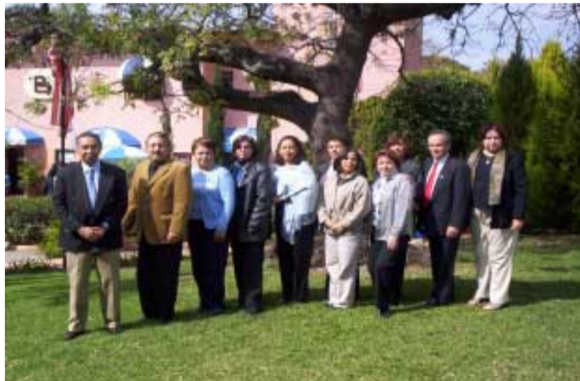
Directivos asistentes a esta Primera Reunión

La Dirección de Asuntos Estudiantiles en apoyo a los estudiantes con necesidades