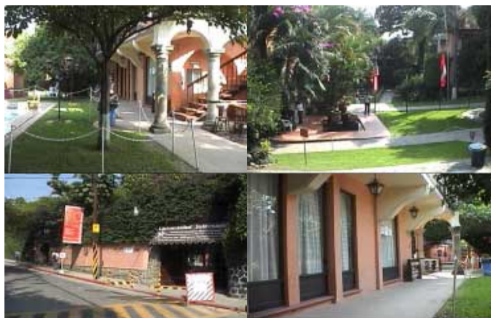
La evolución de UNINTER se ve reflejada en sus instalaciones