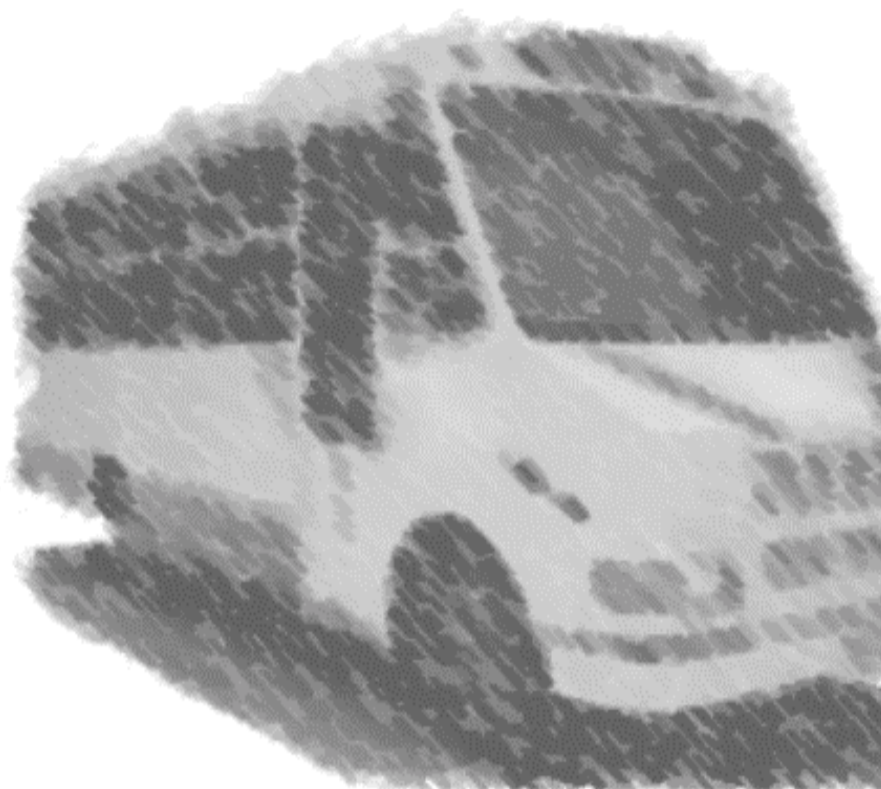
Es necesario aplicar el reglamento a los choferes de ruta

El Reglamento de Tránsito y Transporte para el estado de Morelos dice en su Artículo 1º: “El presente Reglamento establece las normas y requisitos a que debe sujetarse el tránsito de Peatones y Vehículos en las vías públicas del Estado, así como las condiciones y requisitos que deben observarse en la prestación del servicio público de transporte de carga y de pasajeros en la entidad”. Este artículo, es claro y preciso, sin embargo nadie se sujeta a estas normas, a causa del desconocimiento de los conductores, transeúntes y de las mismas autoridades, apreciable en la aplicación del mismo por los policías de tránsito; en la actualidad únicamente se multa a los conductores ¿y qué sucede con los peatones como lo dice el artículo anterior?, ¿cuántas veces la imprudencia de algunas personas ocasiona accidentes?; es entonces cuando se debería aplicar el artículo 122, que a la letra dice: “Los peatones deberán cumplir las disposiciones de este Reglamento, las indicaciones de los agentes de tránsito y