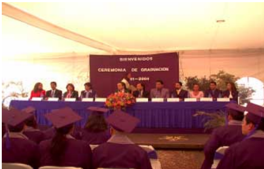
Próximos profesionistas de Universidad Internacional