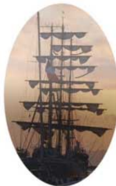
La educación hacia el puerto del aprendizaje

El capitán no puede ni debe hacerlo todo